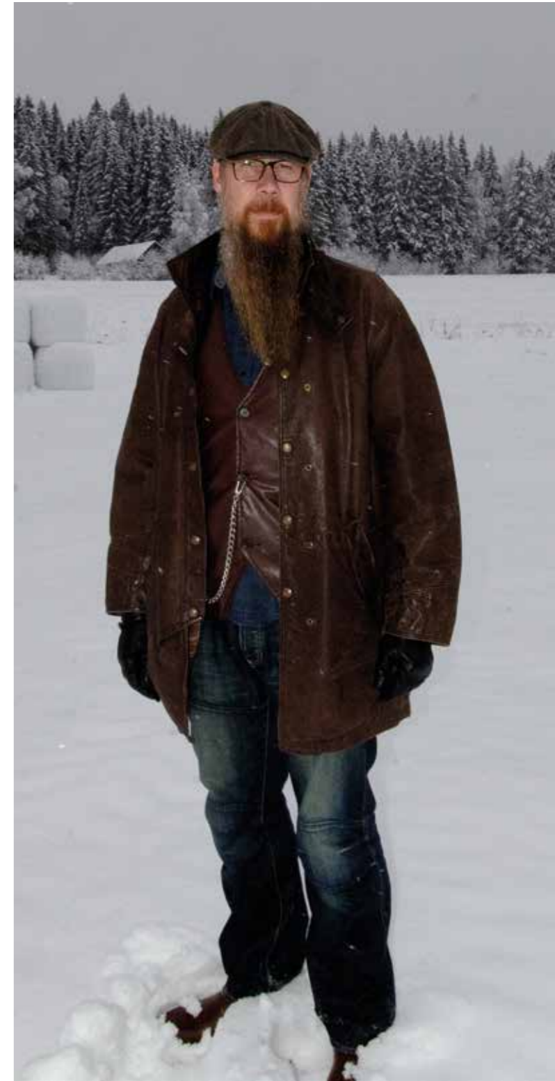
Hela styrelsen presenteras på nästa sida...