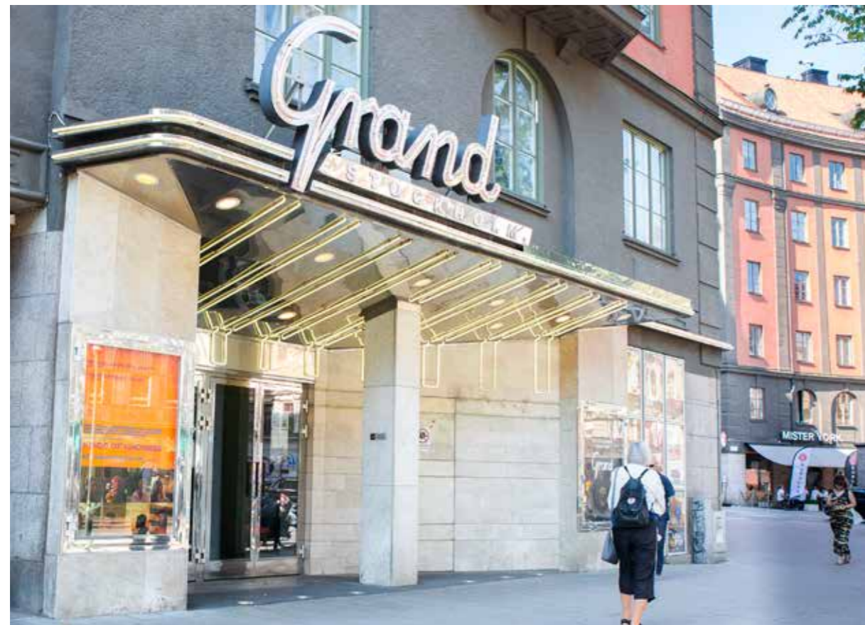
Biografen som Olof och Lisbeth Palme besökte på mordkvällen.