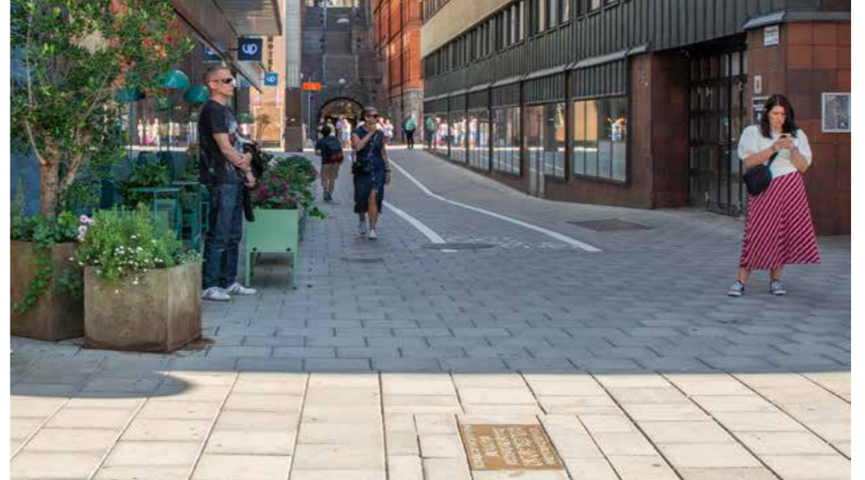
Korsningen Sveavägen/Tunnelgatan där Olof Palme blev skjuten 1986.

I januari 1987 genomfördes dock ”Operation Alfa” där 200 poliser grep 20 kurder.